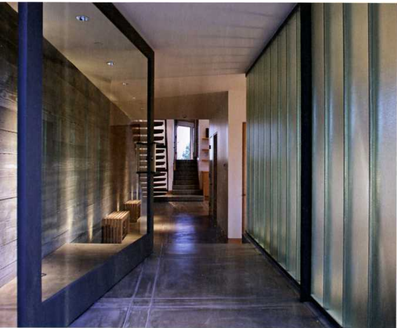
▲ Paredes de betão que retêm o calor, chão de madeira, de árvores certificadas, vidros 'low energy'